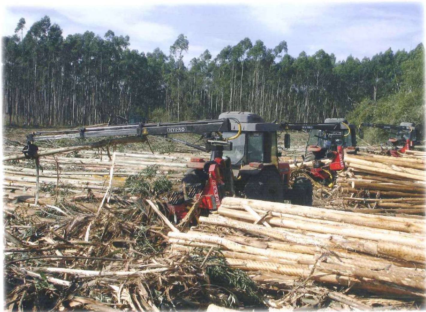
Écorçage d'eucalyptus au Brésil.